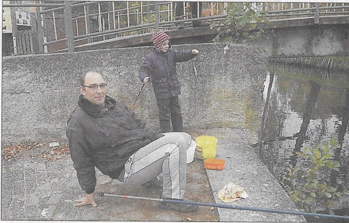
Fünfzehn Angelfreunde des Angelvereins Hecht Neukalen e.V. nahmen am 25. Oktober am traditionellen Abangeln am Hafen der Peenestadt Neukalen teil. Natürlich ging es an diesem Tag